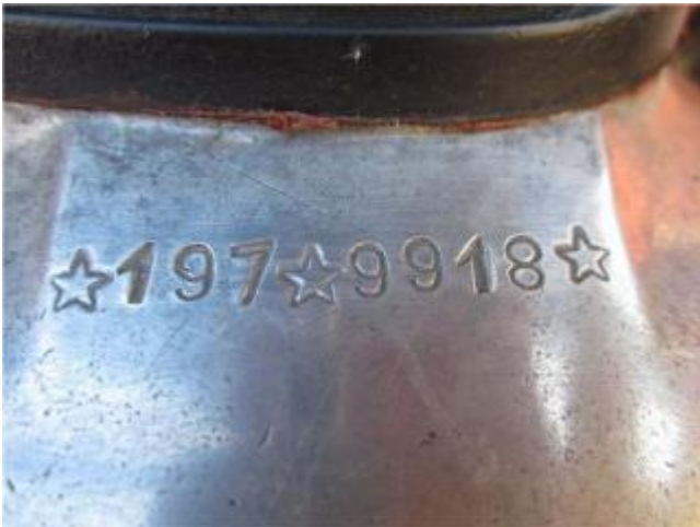
Foto 10x13 TARGHETTA IDENTIFICATIVA