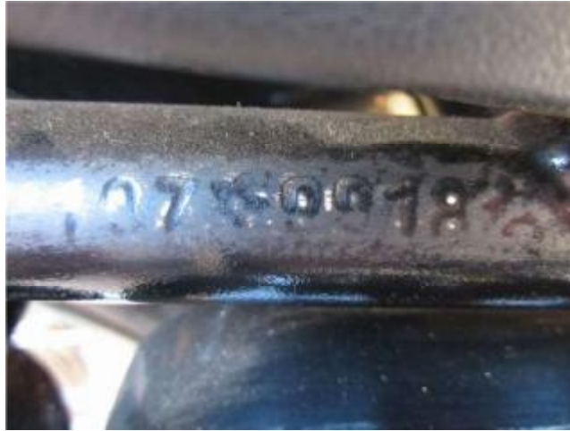
Foto 10x13 PUNZONATURA NUMERO DEL MOTORE