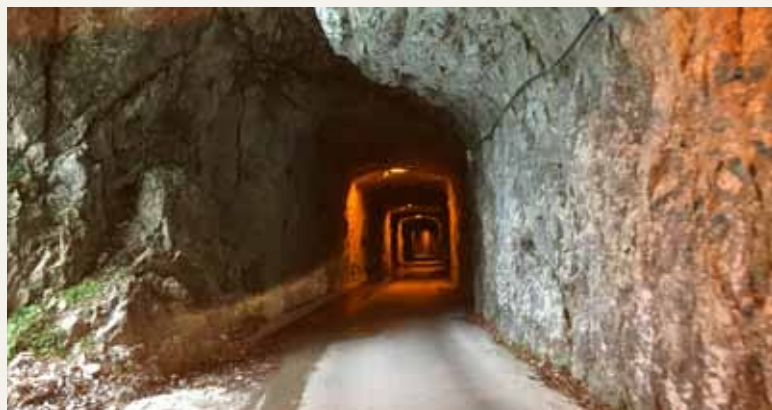
Alcune foto dei meravigliosi paesaggi del percorso di quest'anno...