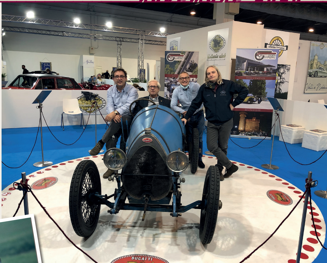
I magnifici 4 Consiglieri nello stand.