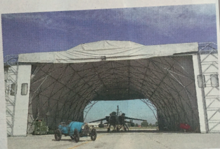
La Bugatti Tipo 13 del 1920, gioiello dell'Historic Club Schio