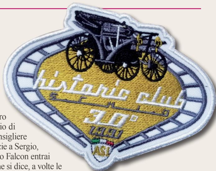
Marchio celebrativo ricamato del 30° dell'Historic