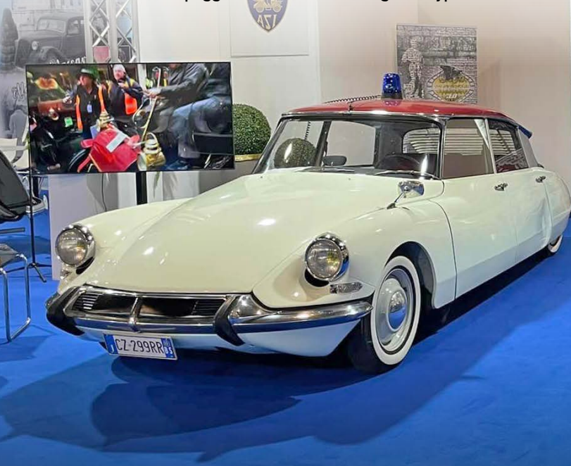
La ID19 con lampeggiante di "Ginko" e la Jaguar E-Type nera di Diabolik

Peugeot Bèbè, 125 anni della Peugeot Type 3, 100 anni della Bugatti T13 Brescia... Insomma, come club siamo convinti di aver dato anche noi un contributo, magari piccolo, alla crescita del livello qualitativo ed alla credibilità di questa fiera; ma i tempi cambiano e le ragioni del business richiedono spazi maggiori, logistica più efficiente e, probabilmente, la ricerca di un target di pubblico più ampio. Noi, un po' nostalgici per natura e passione, ricorderemo e rimpiangeremo il clima della fiera dei primi tempi: un po' provinciale, sincero, genuino e certamente un po' naïf.