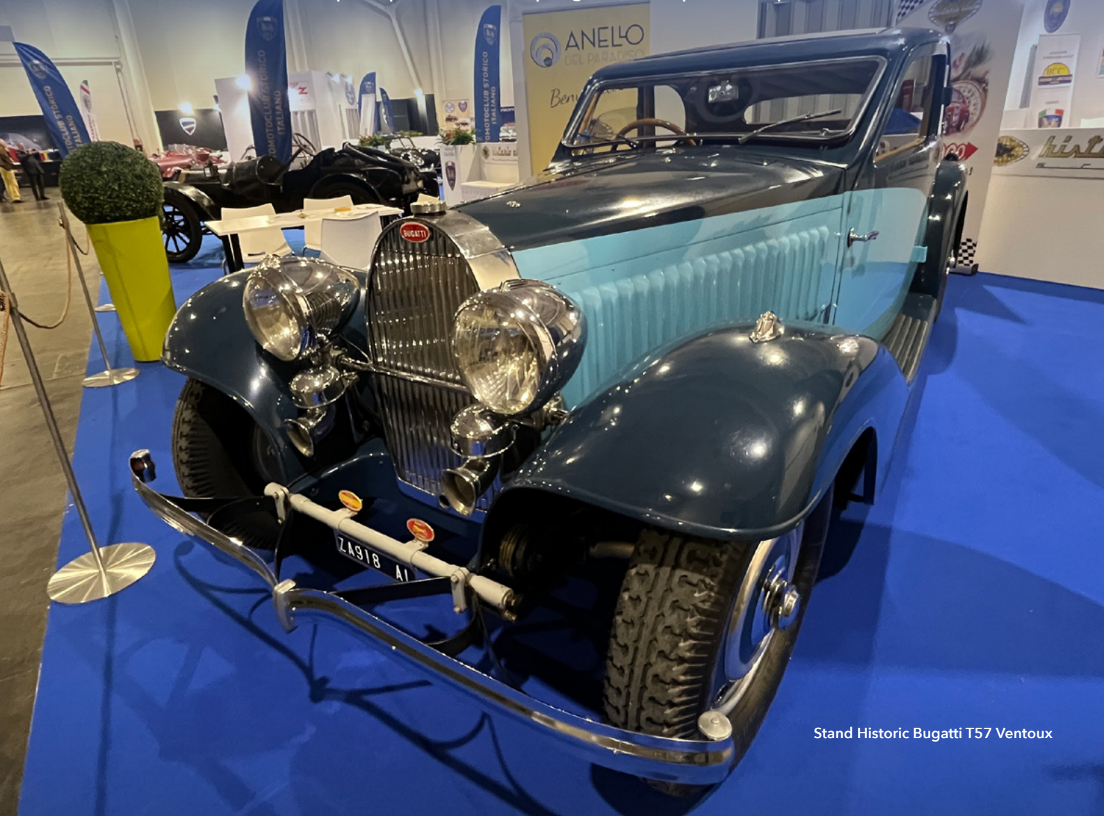
Stand Historic Bugatti T57 Ventoux