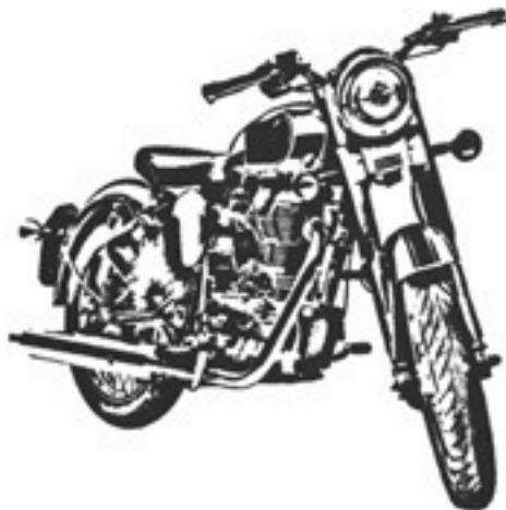
FOTO 10 X 14 VISTA 3/4 POSTERIORE LATO SINISTRO