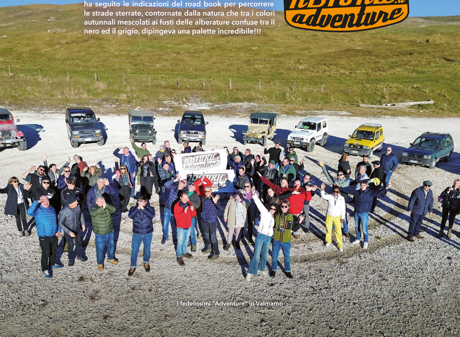
I fedelissimi "Adventure" in Valmaron